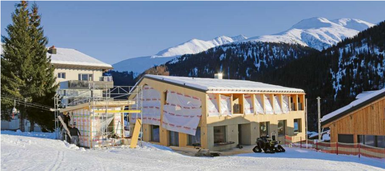
Las davosas lavurs vegnan fatgas avon che l'avertura officiala sappi vegnir festivada sonda proxima.